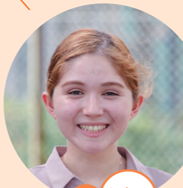
ウズベキスタン出身