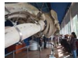
◀水産資料館 すいさんしりょうかん

どうきょう みずべ ある あたら 東京の水辺を歩きます。新しくなった品川から東京海洋大学へ。水産資料館では、大きなクジラの骨が見られます。昼食はもちろん学食で♪そして、天王洲アイランドみかぜ ふ きゅうけい で海風に吹かれながら休憩します。